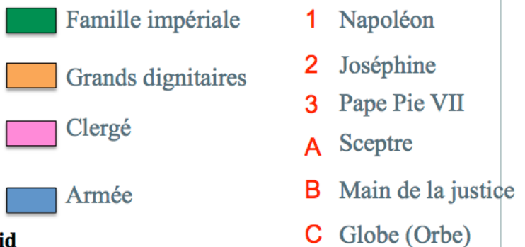
Croquis du Sacre de Napoléon I er de J.-L. David

5) A l'aide de quels éléments J.-L. David montre-t-il la puissance de l'empereur ?