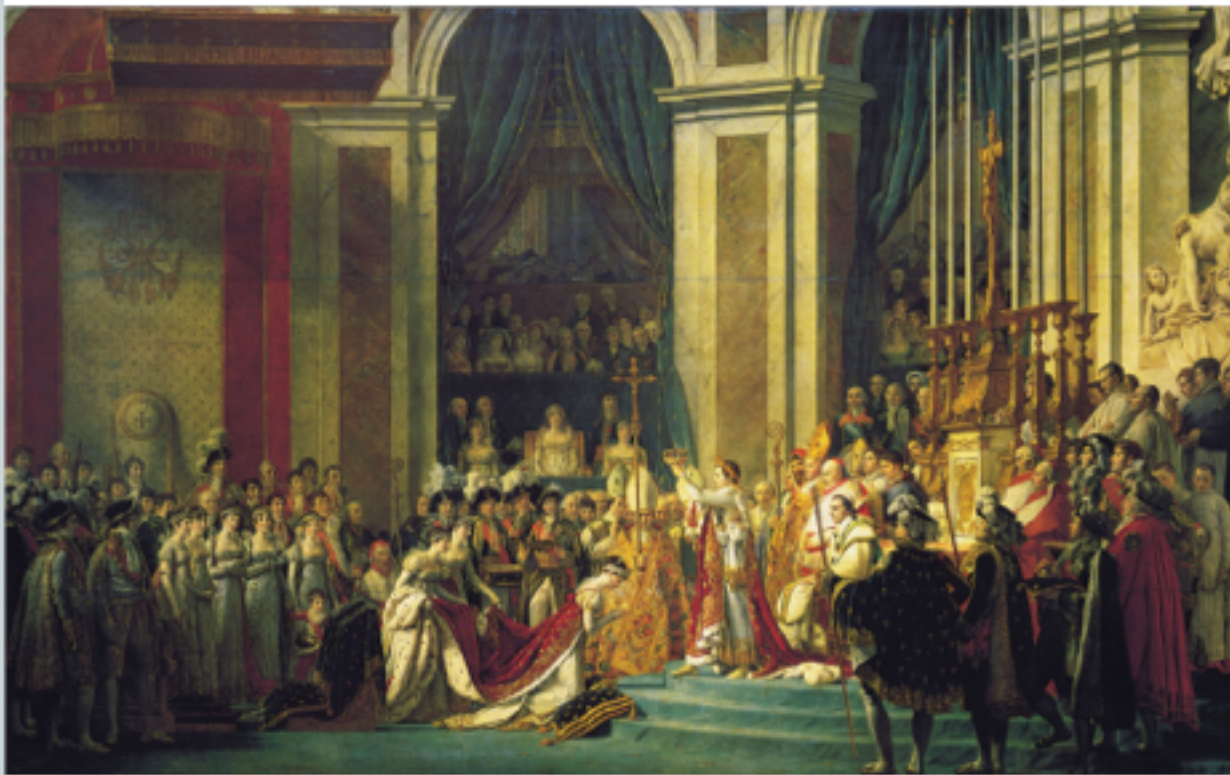
Huile sur toile de J.-L. David ( doc. 2 p. 75 ) : « Sacre de Napoléon I er et couronnement de l'Impératrice Joséphine dans la cathédrale Notre-Dame de Paris, le 2 décembre 1804 ».

Observez attentivement le tableau et décrivez-le :