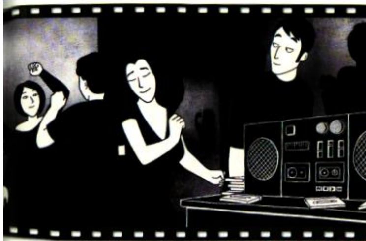
2 Dans un appartement à Téhéran, chez une amie d'