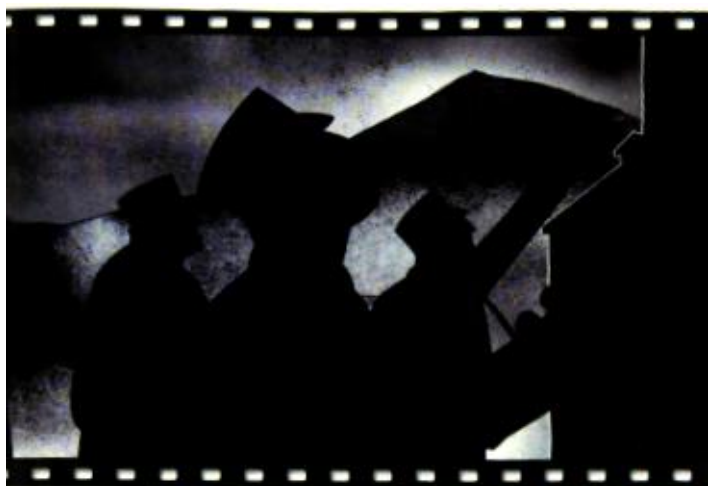
3 Dans la rue au bas de l'immeuble.