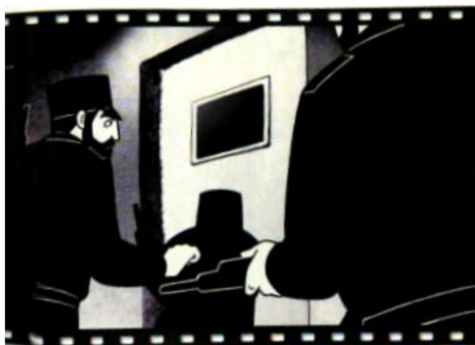
4 À la porte de l'appartement.